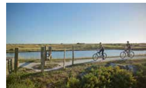
Balade le long de la Flow Vélo