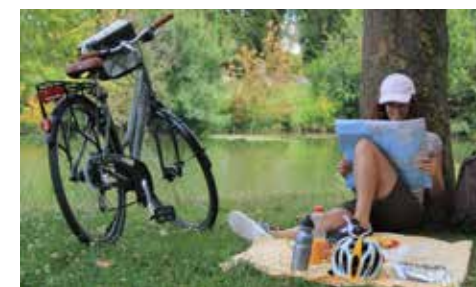
Pause à vélo