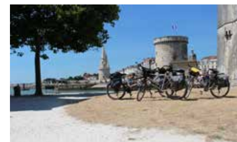
Pause près du Port de La rochelle