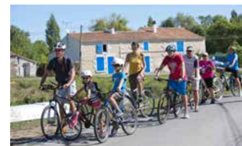
Balade à vélo sur les routes du Vercors